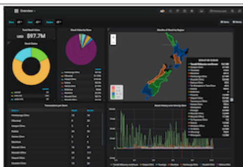
Tableau de Bord mSupply: Manuel utilisateur